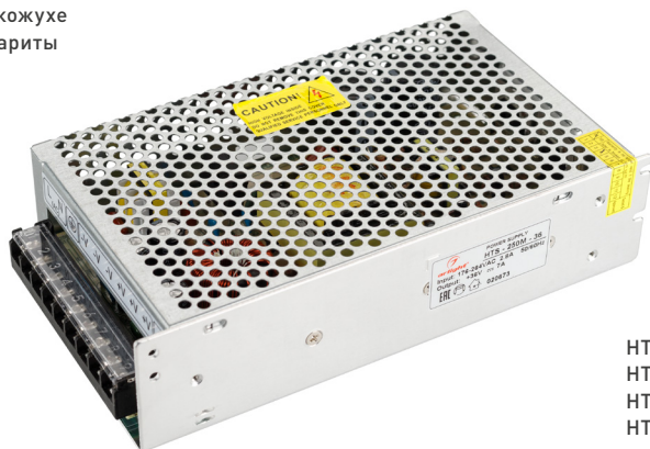
HTS-250M-12 HTS-250M-24 HTS-250M-36 HTS-250M-48